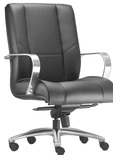
Item 36 Poltrona presidente giratória espaldar alto e apoio de cabeça

Quantidade limite para adesão: 41 Valor unitário: R$ 4.888,00