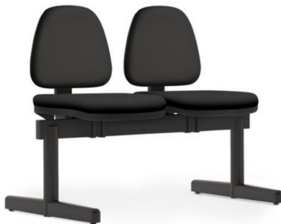
Item 40 Longarina de 2 lugares sem braço encosto médio

Quantidade limite para adesão: 115 Valor unitário: R$ 2.052,00