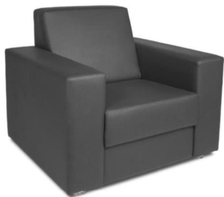
Item 33 Sofá de 01 lugar

Quantidade limite para adesão: 42 Valor unitário: R$ 4.434,00