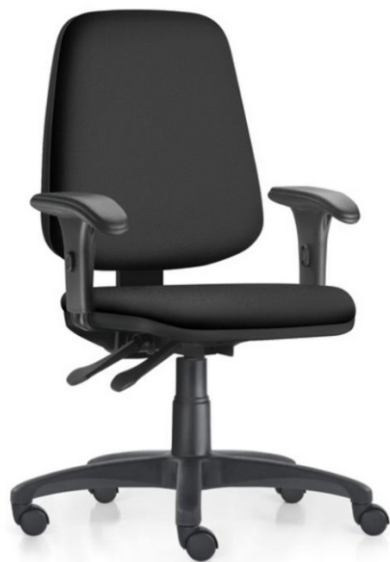
Item 37 Cadeira operacional tipo B com espaldar alto e braço regulável

Quantidade limite para adesão: 417 Valor unitário: R$ 1.561,00