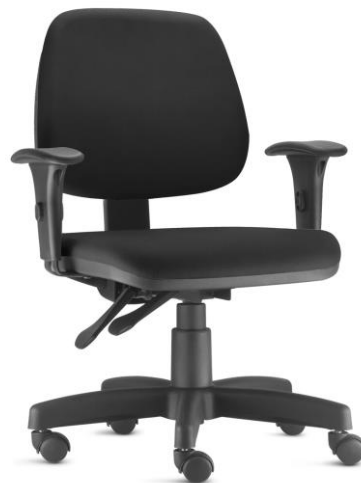
Item 38 Cadeira operacional tipo B com espaldar médio e braço regulável

Quantidade limite para adesão: 417 Valor unitário: R$ 1.561,00