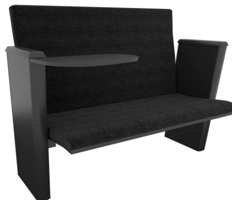
Item 50 Poltrona de auditório com prancheta versão P.O.

Quantidade limite para adesão: 415 Valor unitário: R$ 2.624,00