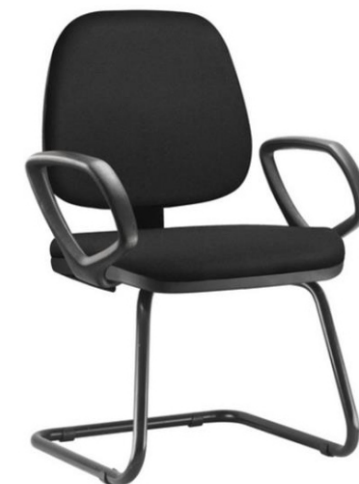
Item 39 Cadeira fixa para diálogo com braço e espaldar baixo

Quantidade limite para adesão: 770 Valor unitário: R$ 1.344,00