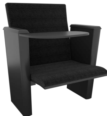
Item 49 Poltrona de auditório com prancheta

Quantidade limite para adesão: 215 Valor unitário: R$ 322,00