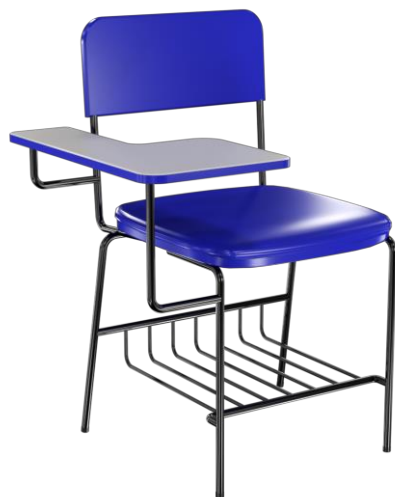
Item 47 Cadeira de treinamento universitária

Quantidade limite para adesão: 415 Valor unitário: R$ 853,00