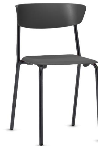
Item 48 Cadeira fixa empilhável de uso múltiplo

Quantidade limite para adesão: 415 Valor unitário: R$ 853,00