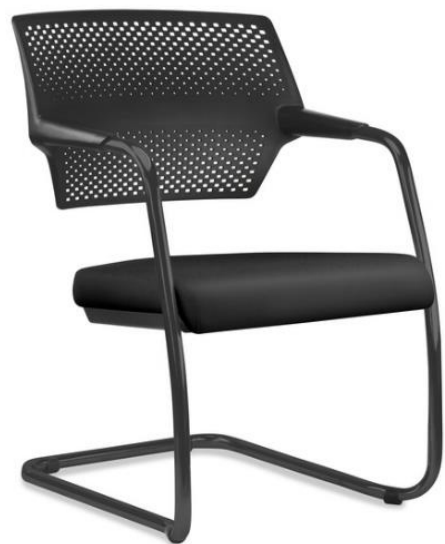
Item 45 Cadeira de diálogo com assento estofado e encosto plástico

Quantidade limite para adesão: 315 Valor unitário: R$ 1.020,00