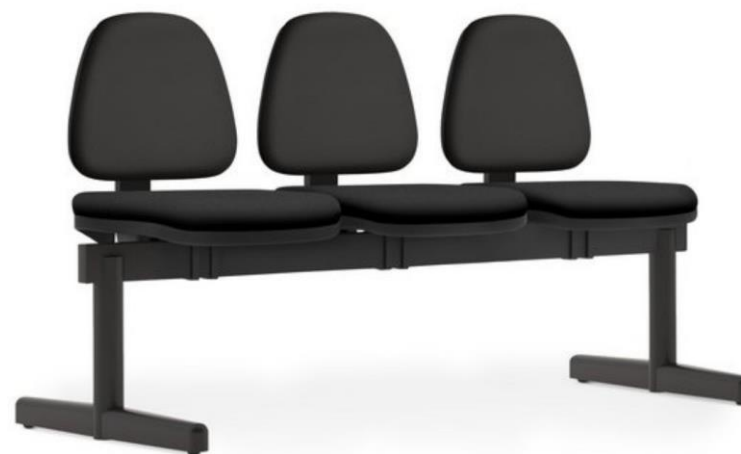
Item 41 Longarina de 3 lugares sem braço encosto médio

Quantidade limite para adesão: 115 Valor unitário: R$ 2.052,00