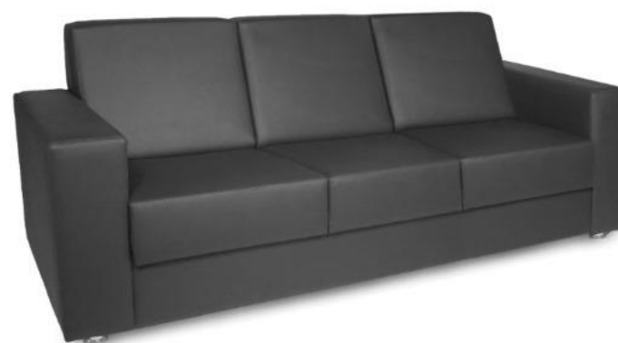
Item 34 Sofá de 03 lugares

Quantidade limite para adesão: 42 Valor unitário: R$ 4.434,00