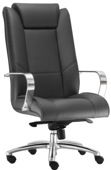
Item 35 Poltrona presidente giratória espaldar alto e apoio de cabeça

Quantidade limite para adesão: 41 Valor unitário: R$ 4.888,00