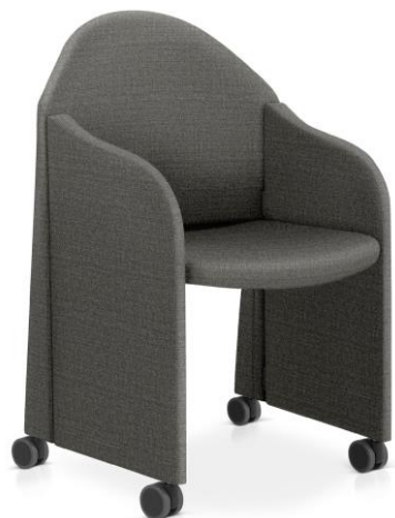
Item 42 Poltrona com rodízios para salas de treinamento e convenções

Quantidade limite para adesão: 60 Valor unitário: R$ 4.880,00