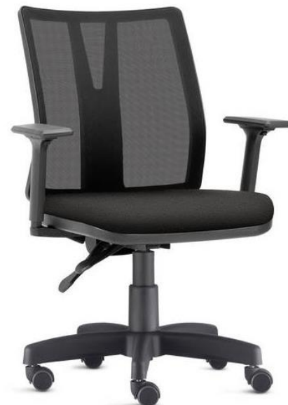
Item 46 Cadeira giratória operacional com braços reguláveis

Quantidade limite para adesão: 315 Valor unitário: R$ 1.020,00