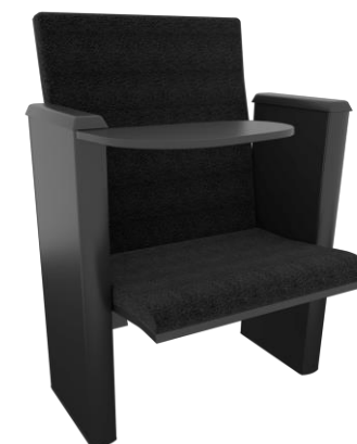
Item 51 Poltrona de auditório com prancheta versão P.M.R

Quantidade limite para adesão: 5 Valor unitário: R$ 7.606,00