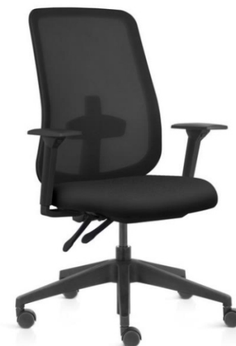
Item 44 Cadeira operacional tipo B com espaldar alto e braço regulável

Quantidade limite para adesão: 157 Valor unitário: R$ 3.888,00