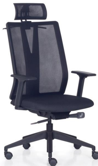
Item 43 Cadeira giratória tipo A espaldar alto e encosto de cabeça

Quantidade limite para adesão: 60 Valor unitário: R$ 4.880,00